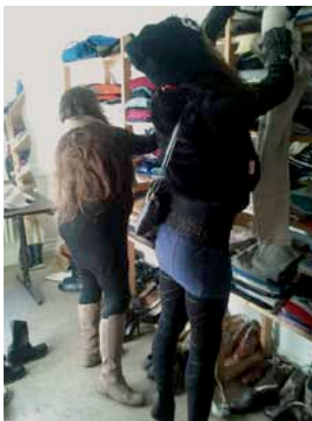
unsere stelleneigene Kleiderbörse