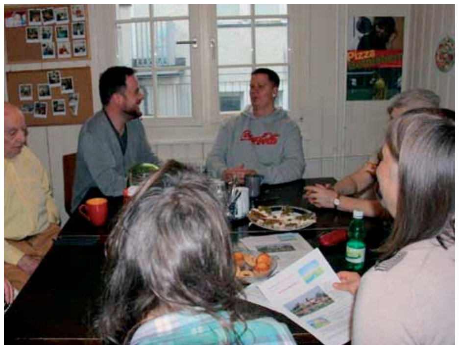
Vernetzung durch Begegnung