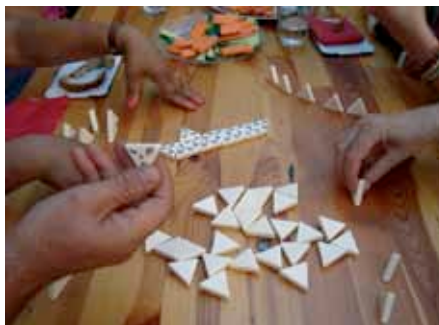
Geselliges Beisammensein im Brennpunkt.

Die Kooperation mit der HEKS-Visite ermöglicht dieses Jahr erneut Einsatzplätze für sechs Sozialhilfebeziehende auf den von uns initiierten Schachfeldern in der Innenstadt. Leider verschwinden immer wieder Schachfiguren, was den Spielbetrieb zeitweise erschwert. Das Schachspielen erfreut sich einer grossen Beliebtheit bei Jung und Alt und schafft Orte der Begegnung zwischen den Generationen.