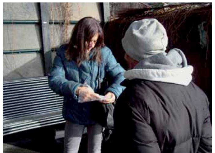
Aufsuchende Sozialarbeit in der Innenstadt

Dadurch, dass wir eine immer grösser werdende Anzahl von Menschen, dank unserer Präsenz, da wo sie sich aufhalten, über Jahre kennen, entstehen Beziehung und Vertrauen. Die Aussage eines Mannes, 45 Jahre alt, während einer Runde am Bahnhof: Dich kenne ich doch, du warst jeweils auch am Pavillon, als die Szene noch nicht aufgelöst war. Ich war lange Zeit nicht mehr in Winterthur. Kannst du mir weiterhelfen, ich steck' im Schlamassel! Von Vielen kennen wir die Lebensumstände bereits, wissen wenn eine Krise sich anbahnt, eine Bezugsperson stirbt, eine Stelle gekündigt wird oder ein Lebensereignis eintritt, das die Bewältigungsmöglichkeiten der betroffenen Person übersteigt. Von solchen Hintergründen haben wir Kenntnis, weil aufsuchende Arbeit die Grundlage unserer Kontakte bildet. Unsere Gegenüber wissen, wer wir sind, entweder, weil sie uns bereits persönlich kennen, oder weil sie von uns gehört haben. Diese regelmässige Präsenz im Alltag der Betroffenen im öffentlichen Raum und an den Treffpunkten findet auf Augenhöhe statt und ist nicht durch psychiatrische Diagnosen und Fallakten geprägt. So haben wir Zugang zu Menschen, welche sonst kaum mehr erreicht werden.